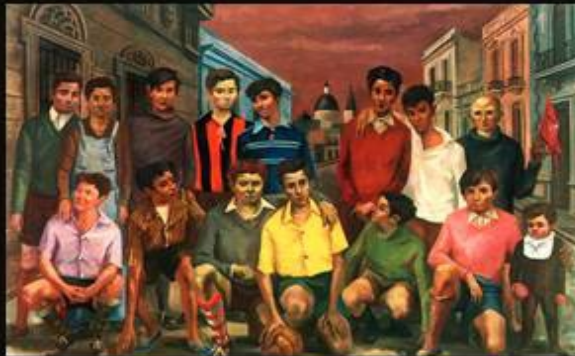
Equipo de Futbol

Trío de Imanes: Antonio Berni Tamaño: 5 x 4 aprox.