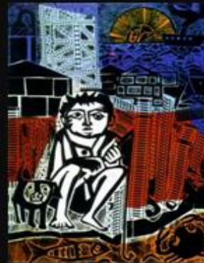
Sin título Xilografía