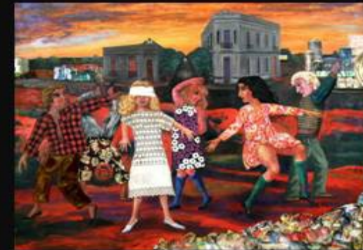
La Gallina Ciega

Hacé tus pedidos y Unite a otras piezas!